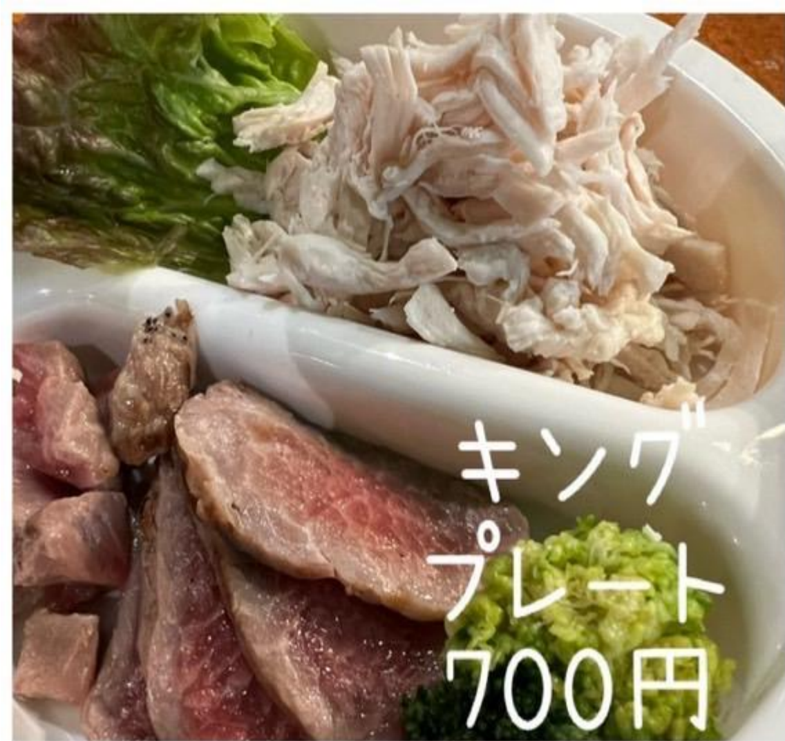
キング プレート 700円