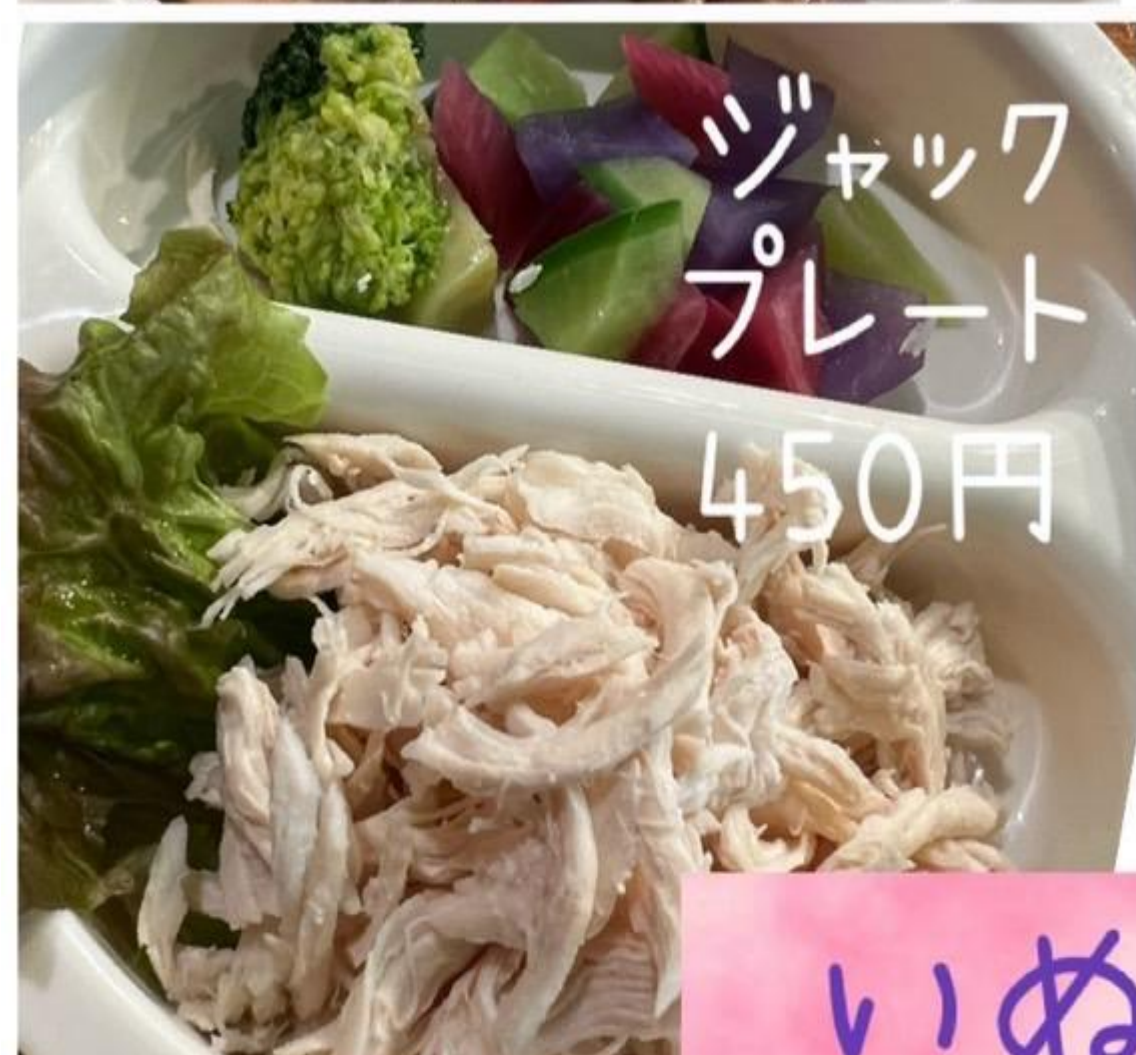
ジャック プレート 450円