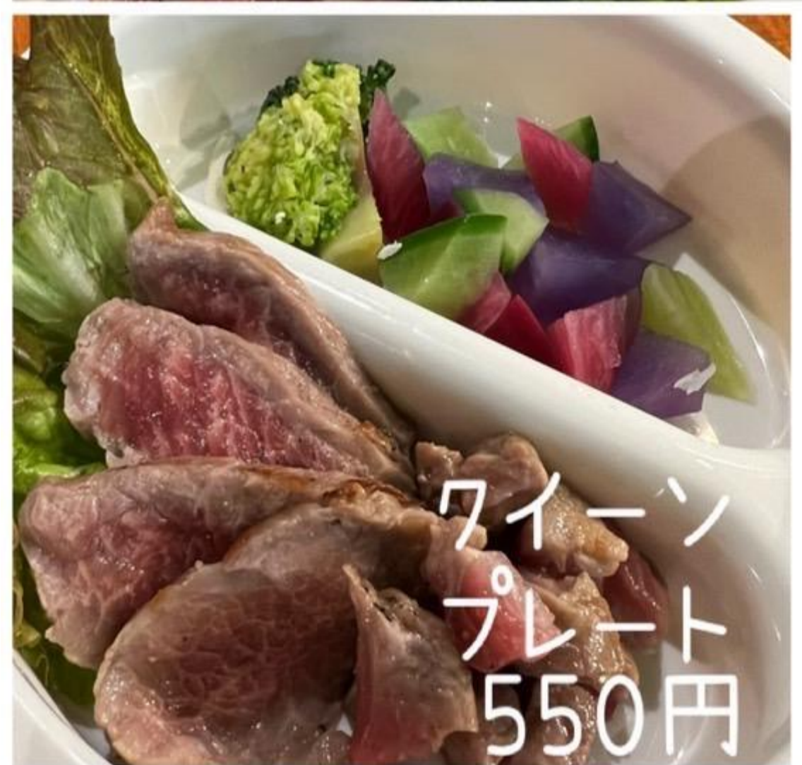
クイーン プレート 550円